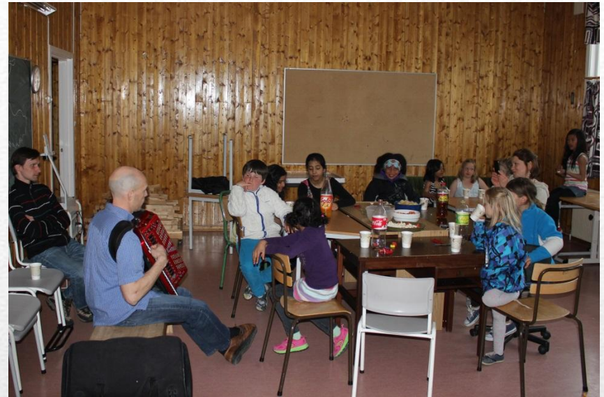
Fra øvingshelga mai 2013

Under denne helga satte vi sammen forestillingen.