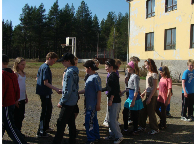
Illustrasjon 7: Her takker vi av etter kampen.

Tilbake på skolen fikk elevene arbeidsbøkene sine, slik at de kunne få msn/facebook adresser av de finske elevene. Vi avsluttet dagen med en boballkamp (slåball) mellom Norge og Finland. De hadde andre regler enn hva elevene var vant til fra Norge. Våre elever spiller også mye slåball, men de tapte noen poeng på at i boball kan det bare være en i hvert bo. Vi spilte godt, men Finland vant med ett poeng. Så hadde de jo også hjemmebane.