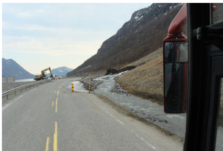
Illustrasjon 1: Veien gjennom Langfjorden var merket av det kraftige mildværet i helga. Vi kjørte forbi flere ras. Her fjernes rasmasser fra et av dem.

Uke 20 dro finskelevene i Kvænangen, fra 5. til 9.klasse, til Finland. Turen startet klokken halv ni fra Jokerbutikken i Badderren. Bussjåføren, Bård, var der alt kl. 08.15.