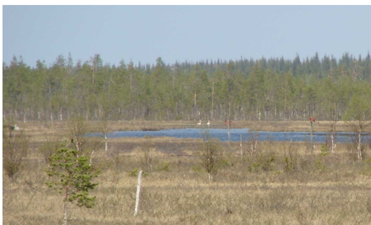
Illustrasjon 6: Fra rasteplassen så vi svaner og noen av elevene fra Finland fant en firfirsle.