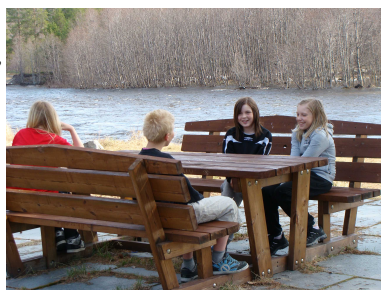
Illustrasjon 2: Noen timer etter at vi dro herfra, grov denne elva av veien til Kautokeino.

Starten gikk 08.30 fra Badderren. I Burfjord hadde vi et lite stopp på Statoil, der finskelevene fra Spildra kom på. Deretter kjørte vi strake veien gjennom Langfjorden og tok av mot Kautokeino.