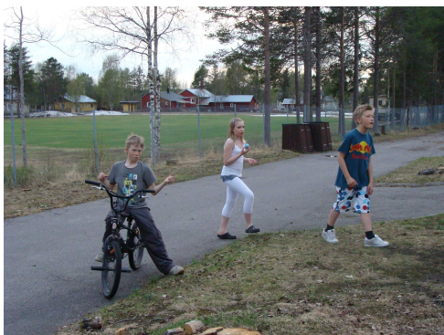
Illustrasjon 3: Denne fine campingplassen lå vi på.

filmen fra Mikael Niemis kjente bok, - «Populær musikk fra Vittula». Ikke alle hadde tid til å følge med på denne, men var mest opptatt av å drive sosial samkvem med de andre. I Mounio stoppet vi og spiste pizza på Jerusalem. Det var dagens middag. Klokka 6 var vi fremme i Pajala.