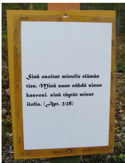
Illustrasjon 5: Langs stien sto det bibelvers. Blant annet dette: "Du viste meg livets vei. Jeg får se ditt ansikt, du fyller meg med glede."

Vi gikk et godt stykke etter en sti før vi kom til en leirplass. Før i tiden brukte folk denne stien for å komme seg til Pajala for å gå i kirken. Folk gikk i flokk å følge for å høre Læstadius preke. Derfor har den fått navnet Læstadius-polkku.